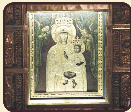
Obraz Matki Boskiej Pocieszenia w Kawnicach

Według podań pochodzi on z Lwowa. W 1974 r. kardynał Stefan Wyszyński ozdobił obraz koronami