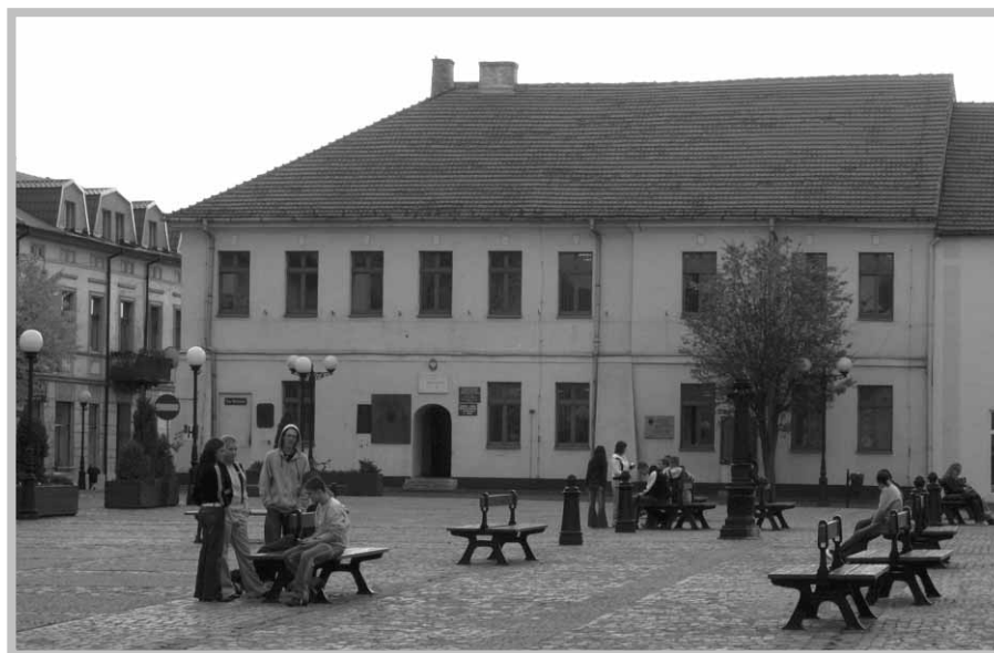
Dom Zemelki