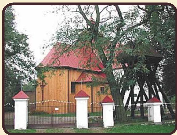
Kościół p.w. św. Jakuba Apostoła

Ciekawym zabytkiem miasta, będący przykładem drewnianej architektury sakralnej jest kościół p.w. św. Jakuba Apostoła, zbudowany w latach 1765-67 (pierwsze wzmianki o nim pochodzą już z 1470 r.). Wnętrze świątyni podzielone jest profilowanymi słupami na trzy nawy. W głównym barokowym ołtarzu, z rzeźbami św. Stanisława Biskupa i św. Wojciecha, znajduje się obraz „Ukrzyżowanie” z Matką Boską, św. Janem, św. Magdaleną i donatorem z ok. 1600 r. Dwa boczne ołtarze barokowe, mają późniejsze XIX-wieczne obrazy św. Walentego i św. Izydora. W wyposażeniu świątyni warto zwrócić jeszcze uwagę na ambonę rokokową oraz dwie ludowe rzeźby drewniane: św. Sebastiana i Chrystusa na Krzyżu. Po bokach świątyni znajdują się dwie kaplice: od strony północnej - murowana z 1696 r., a od południowej - drewniana z XIX wieku.