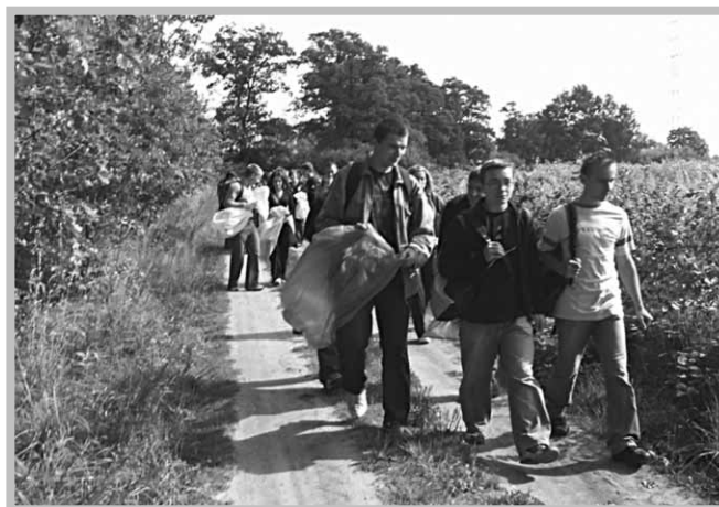
Uczniowie Zespołu Szkół Ponadgimnazjalnych w Sompolnie sprzątają świat.