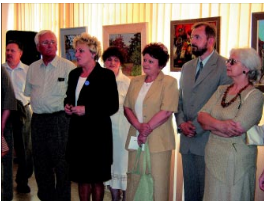
Liczenie przybyłych gości powitała Elżbieta Streker-Dembińska Starosta Koniński.

O atrakcjach, jakie oferuje Ziemia Konińska przekona się każdy, kto wybierze się w te strony w celach turystyczno – rekreacyjnych. Jednak wizyta w Powiatowej Galerii Malarstwa, nie tylko wzbogaci nasze spojrzenie na jej piękno ale stanie się prawdziwą uczcą kulturalną.