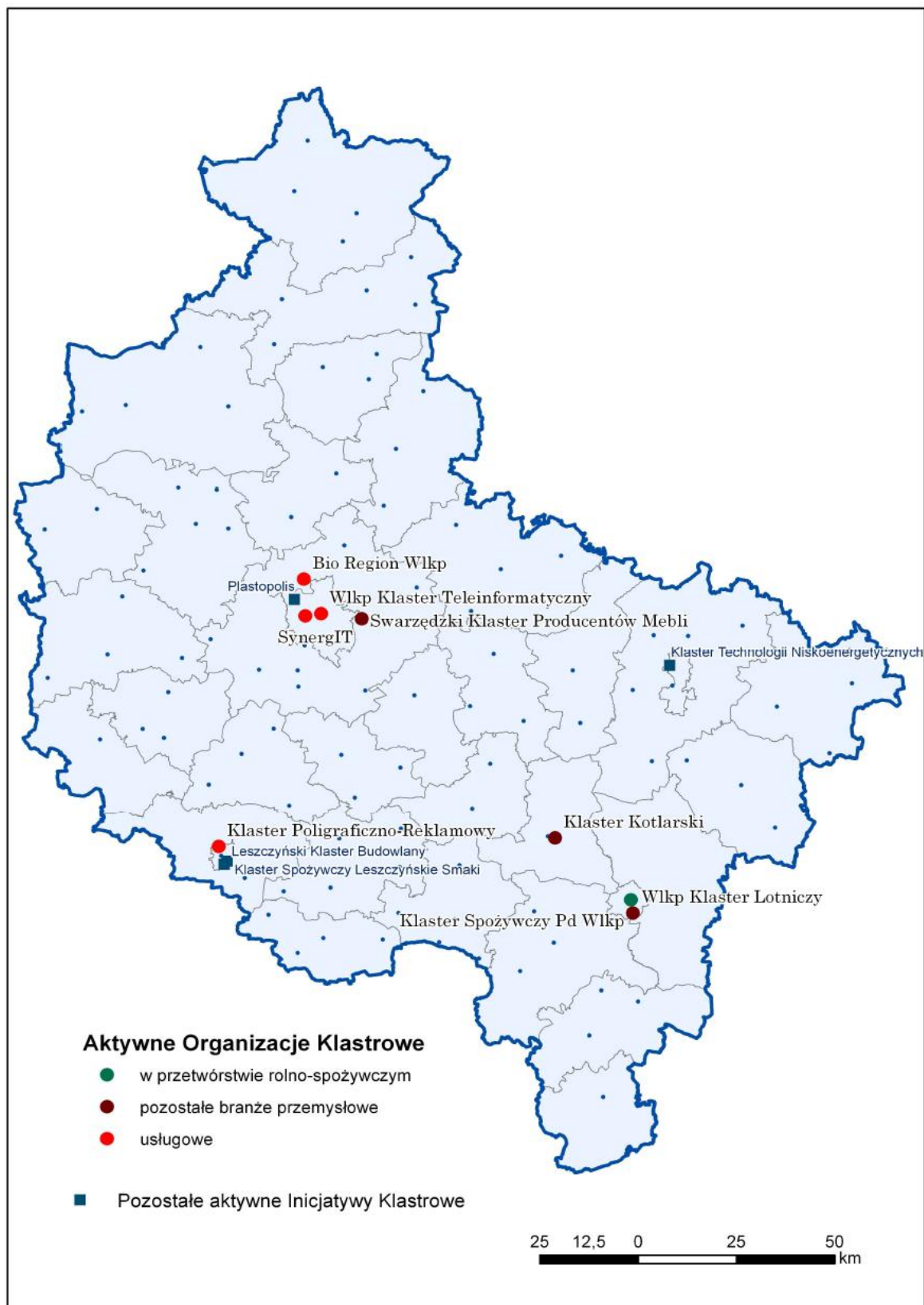
Rysunek 6: Siedziby organizacji i inicjatyw klastrowych w Wielkopolsce.