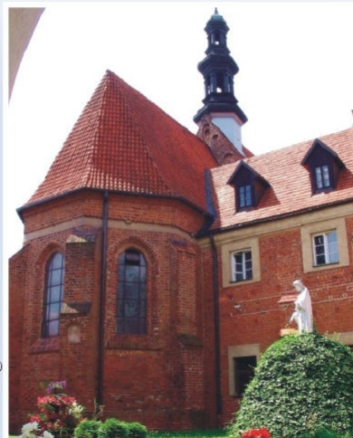
Kościół klasztorny w Kazimierzu Biskupim