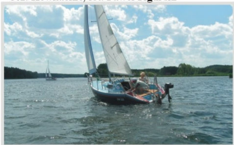
Jezioro Ślesińskie