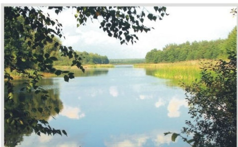
Jez. Kownackie