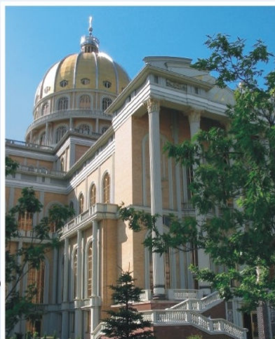
Bazylika w Licheniu Starym