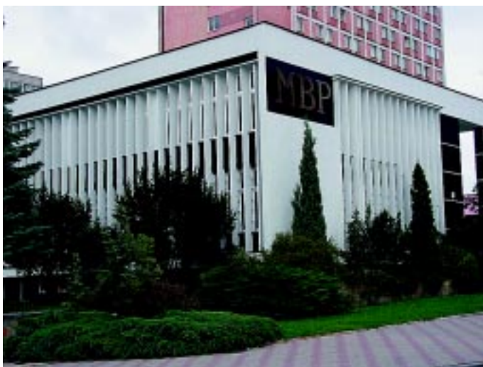
W bibliotece najmłodszy mieszkańcy miasta na pewno nie będą narzekać na nudę

18.00 na gry planszowe. W zajęciach plastycznych można także wziąć udział 22 i 29 sierpnia.