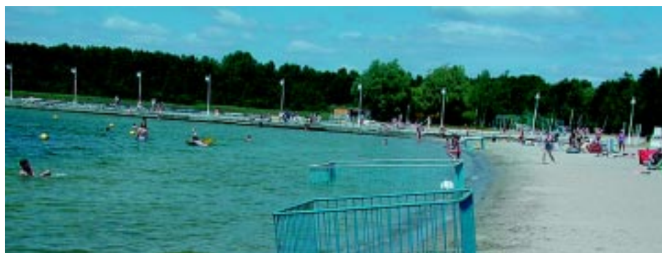
W specjalnym kojcu, na brzegu plaży, maluch poczuje się bezpiecznie

A dla nieco starszych maluchów przygotowano brodzik. Tam, pod okiem „słonecznego patrolu” ze Skorzęcina, dzieci mogą spokojnie pomóc się w jeziorze, a nawet spróbować po raz pierwszy pływać! Zapraszamy do ośrodka!