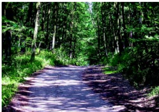
W powiecie konińskim ścieżki rowerowe prowadzą przez lasy

skich wytyczonych szlaków. Znaczna jego część znajduje się w granicach powiatu ko-