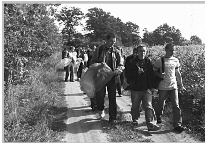
Uczniowie Zespołu Szkół Ponadgimnazjalnych w Sompolnie sprzątają świat.

Halina Dąbrowska Wydział Ochrony Środowiska