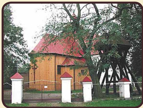
Kościół p.w. św. Jakuba Apostoła

Ciekawym zabytkiem miasta, będący przykładem drewnianej architektury sakralnej jest kościół p.w. św. Jakuba Apostoła, zbudowany w latach 1765-67 (pierwsze wzmianki o nim pochodzą już z 1470 r.). Wnętrze świątyni podzielone jest profilowanymi słupami na trzy nawy. W głównym barokowym ołtarzu, z rzeźbami św. Stanisława Biskupa i św. Wojciecha, znajduje się obraz „Ukrzyżowanie” z Matką Boską, św. Janem, św. Magdaleną i donatorem z ok. 1600 r. Dwa boczne ołtarze barokowe, mają późniejsze XIX-wieczne obrazy św. Walentego i św. Izydora. W wyposażeniu świątyni warto zwrócić jeszcze uwagę na ambonę rokokową oraz dwie ludowe rzeźby drewniane: św. Sebastiana i Chrystusa na Krzyżu. Po bokach świątyni znajdują się dwie kaplice: od strony północnej - murowana z 1696 r., a od południowej - drewniana z XIX wieku.