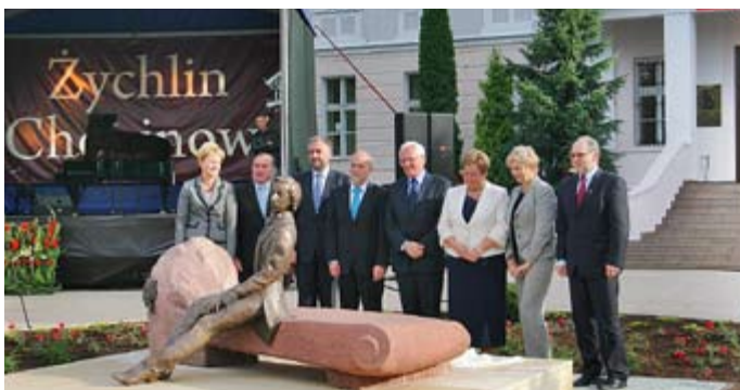
Pierwsze wspólne zdjęcie z pomnikiem młodego Fryderyka Chopina.