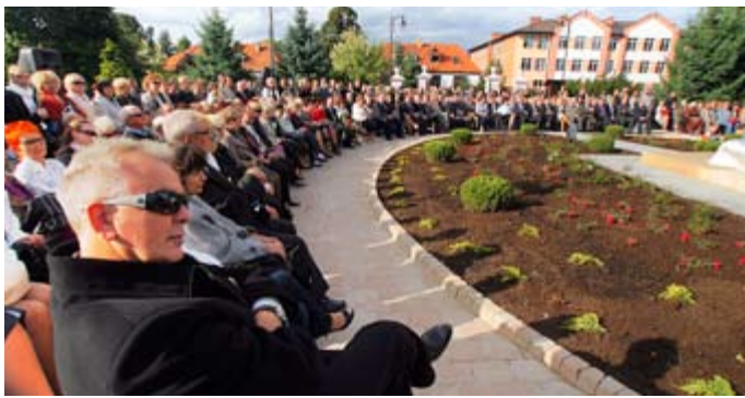
Żychlińskie obchody zgromadziły liczną publiczność.