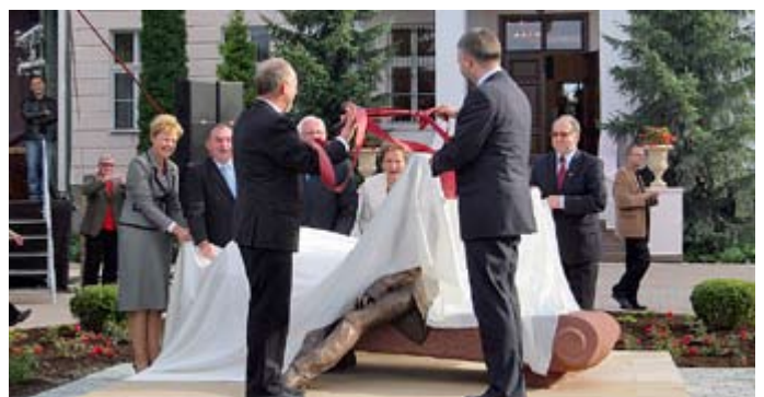
Moment uroczystego odsłonięcia.