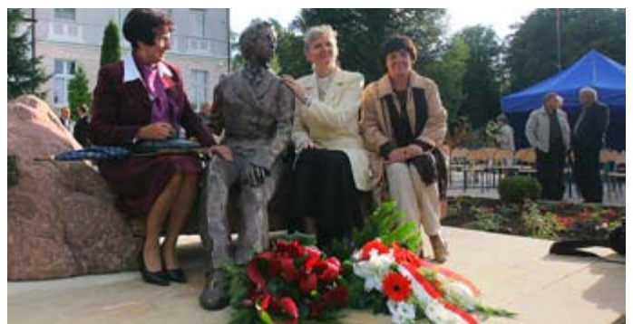
A po oficjalnej uroczystości każdy chciał przysiąść na ławce z Chopinem.