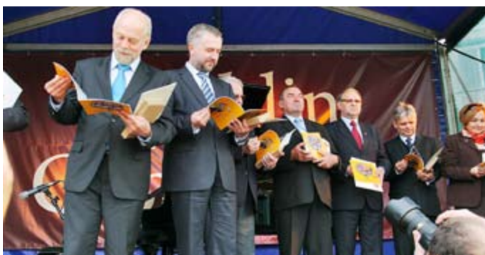
Pierwsi czytelnicy komiksu „Chopin na weselu, czyli Fryderyka przygody na mniej poważną nutę”.