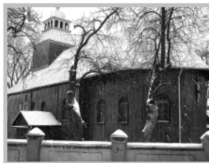
Kościół pw. Św. Jakuba

Siedzibą gminy jest bardzo stara osada – Rzgów. Pierwsze wzmianki o jej istnieniu pochodzą już z XII w. Stanowiła wówczas posiadłość klasztoru cystersów w Łądzie. Później stała się wsią szlachecką. W czasie okupacji hitlerowskiej w latach 1940-41 istniało tu getto dla ludności pochodzenia żydowskiego. Obecnie wieś spełnia rolę siedziby władz samorządowych i administracji gminnej, a także lokalnego ośrodka handlu i usług.