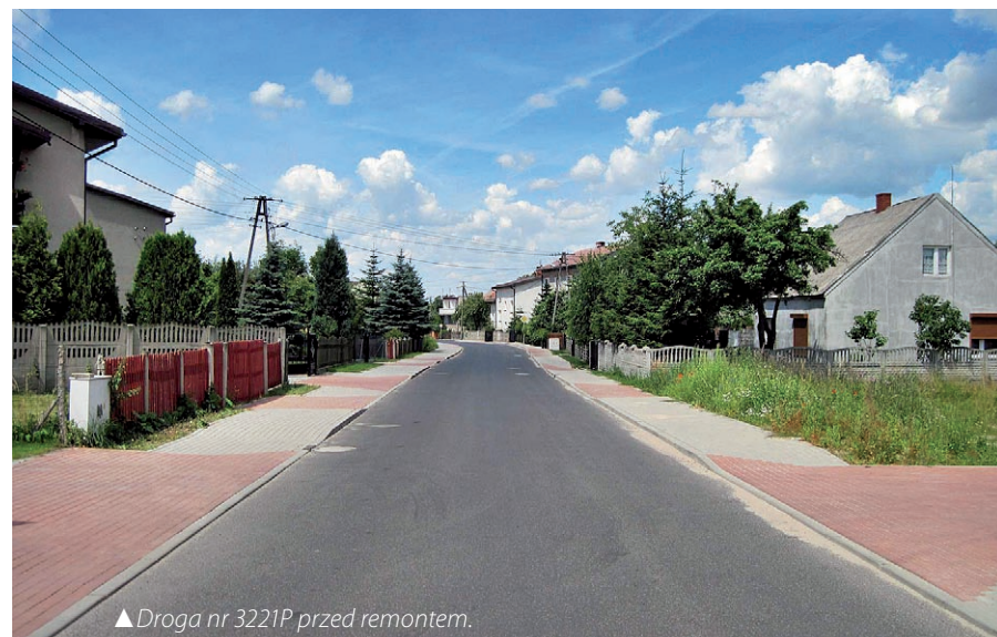
▲ Droga nr 3221P przed remontem.

Warto dodać, że w latach 2010 – 2014, samorząd powiatu konińskiego przeznaczył na realizację projektów inwestycyjnych w drogownictwie 58,5 mln zł, w tym budowa i remonty dróg pochłonęły prawie 48 mln zł. W efekcie intensywnych prac modernizacyjnych oddano do użytku 71 km nowej nawierzchni dróg oraz 18,4 km.