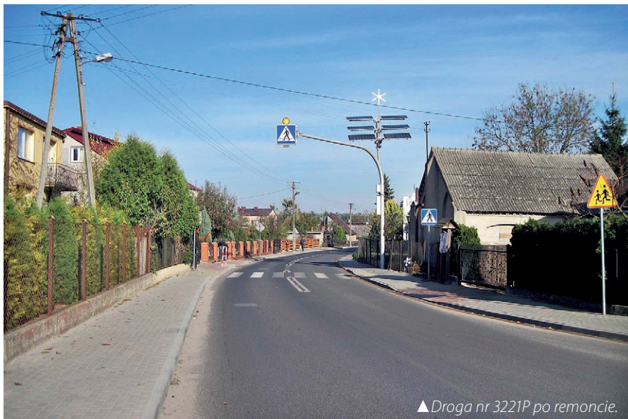
▲ Droga nr 3221P po remoncie.

Wojewoda Wielkopolski ogłosił listę rankingową wniosków o dofinansowanie zadań przewidzianych do realizacji w 2015 r. w ramach „Narodowego Programu Przebudowy Dróg Lokalnych – Etap II Bezpieczeństwo – Dostępność – Rozwój”.