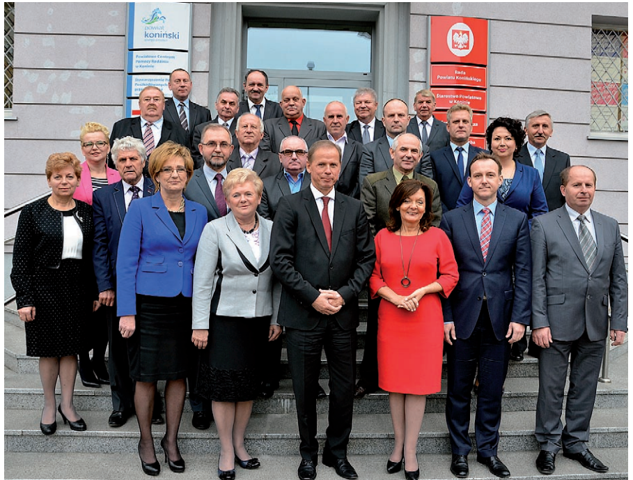
▲ Zarząd i Rada Powiatu Konińskiego IV kadencji 2010 - 2014