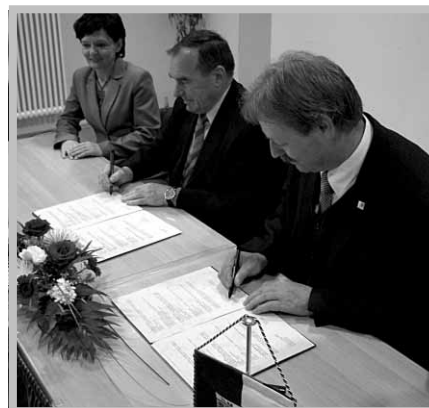
Władze obydwu samorządów podczas podpisywania Protokołu.

pracy bezpośredniej szkół ponadgimnazjalnych w Kleczewie i Ilmenu. Wizytę grupy uczniów gimnazjum Am Lindenberg w Kleczewie.