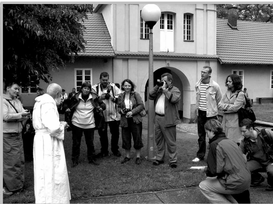
Spotkanie z gospodarzami Klasztoru w Bieniszewie.