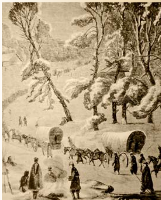
Furgony powstańcze z zapasami żywności i amunicji

Pod koniec maja 1863 r. na pole walki w Konińskim ponownie wkroczył Edmund Callier, który na