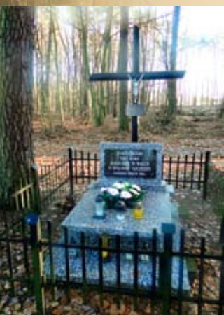
Mogiła w Smuczynie upamiętniająca walczących pod Olszowym Młynem

było wciąż wycofywać się przed zacieśniającym się pierścieniem sił nieprzyjaciela.