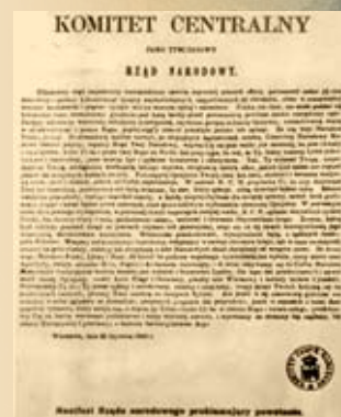
Manifest Rządu Narodowego proklamujący powstanie