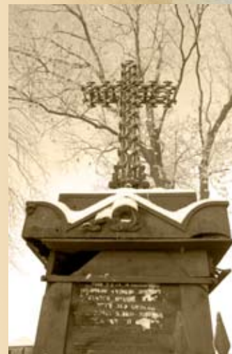
Nagrobek na cmentarzu w Myśliborzu koło Golicy