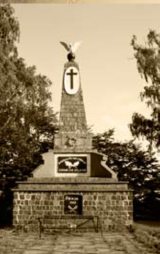
Pomnik upamiętniający bitwę pod Ignacem

28 maja oddział Calliera pojawił się w lasach między wsiami Wakowy i Trześniewo. Stąd powstańcy wyruszyli do Chylina. Potem – 30 maja – wyruszyli do wsi Grochowy. Po wyjściu ze wsi, oddział stanął na styku lasów grodzieckich, biskupskich i zbierskich. Tutaj został zaatakowany przez Rosjan, jednak po ostrzale ze strony polskiej nieprzyjaciel był zmuszony do odwrotu. Wówczas odsoniło się skrzydło rosyjskie. Tę nieoczekiwaną sytuację Słupski wykorzystał i poprowadził powstańców do boju. Po trzech godzinach wymiany ognia Rosjanie zdecydowali