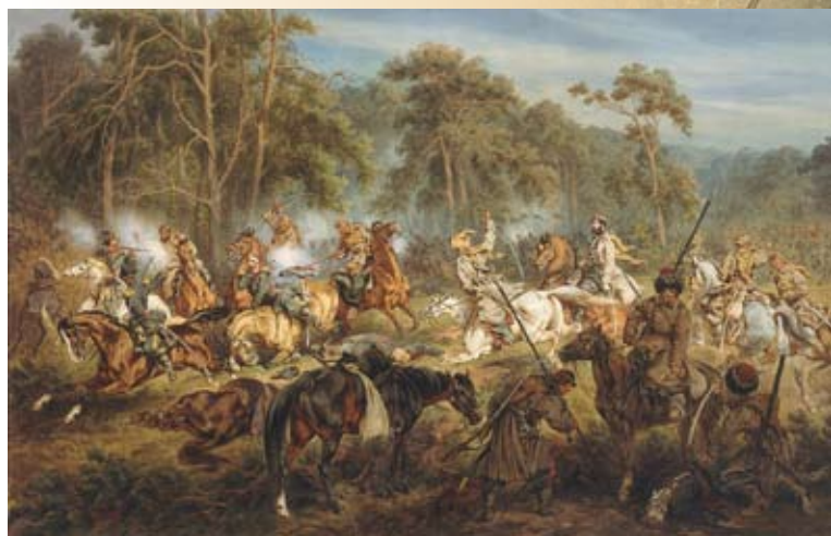
Bitwa pod Ignacewem, akwarela Juliusza Kossaka

Bitwa pod Ignacewem stoczona 8 maja 1863 r. to jeden z najważniejszych epizodów militarnych insurrekcji styczniowej w Konińskim. Tu Edmund Taczanowski dowiedział się, że od Lubstowa nadciągają wojska carskie. Wymęczone intensywnym marszem oddziały powstańcze nie były już w stanie szybko wycofać się w kierunku Przedcza i musiały przyjąć bitwę. Rosjanie pojawili się bardzo szybko i rozpoczęli atak, zanim powstańcy zdolali się umocnić na wybranych pozycjach. Po ponad godzinnej walce oddziały carskie przypuściły od strony Ruszkowa