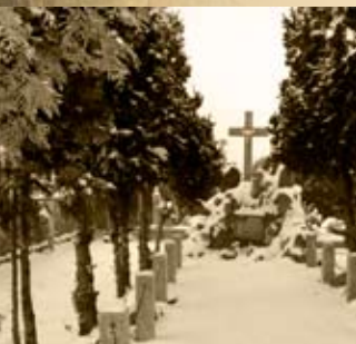
Mogiła powstańcza w Dobroszowie, gm. Kazimierz Biskupi