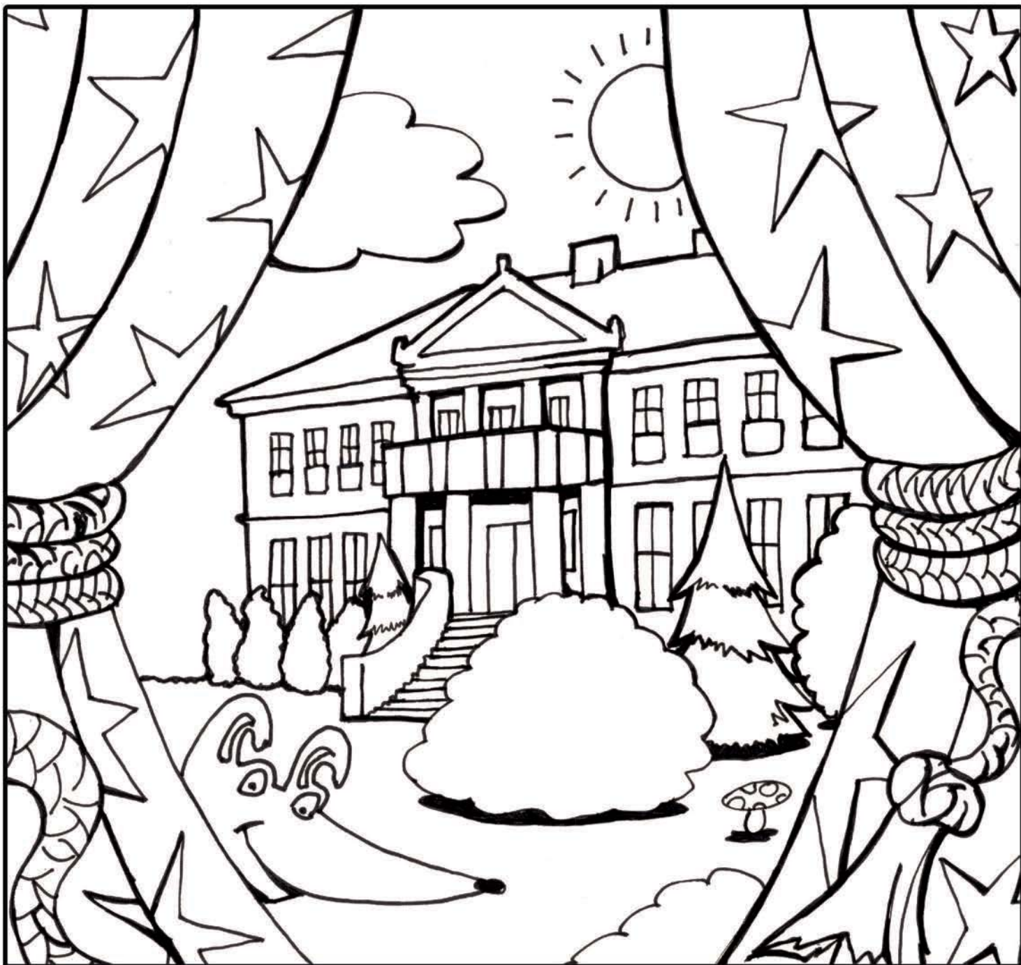
Pałac Bronikowskich w Żychlinie