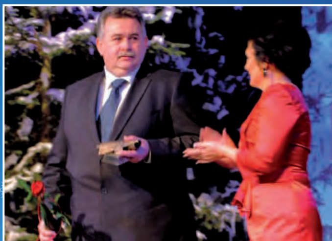
Nagroda gospodarcza Powiatu Konińskiego „Za osiągnięcia ekonomiczne” – PUP GALWAMET z Brzeźna