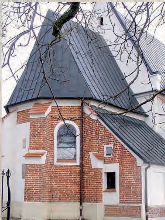
Kościół parafialny św. Michała Archanioła w Królikowie.

R zgów – dawna posiadłość klasztoru w Łądzie. Od schyłku XIV w. własność szlachecka z kościołem parafialnym pw. św. Jakuba Apostoła, świadczącym o roli cystersów w krzewieniu kultu tego ucznia Chrystusa. Rzgów należał do najstarszego uposażenia opactwa łędzkiego. W XIII bądź w następnym stuleciu stał się wsią rycerską (szlachecką). Jednakże śladem pobytu braci zakonnych w tej wsi jest ufundowana przez nich świątynia parafialna.