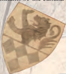
Zaremba coat of arms. Heraldic framing in St. Jacob the Apostle chapel in Łąd by Warta River.

Hill fort and the late Gothic parish church with two Romanesque slabs (placed on the outside of the presbytery) can be enumerated among the most interesting remnants of the cultural heritage preserved in Królików.