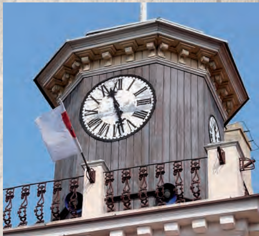
Osiemnastowieczny zegar z pocysterskiego kościoła klasztornego w Łądzie. Ratusz w Koninie.

W XIX w. z niszczonego kościoła pocysterskiego w Łądzie władze Konina zakupiły zegar, który zamontowano na ratuszu.