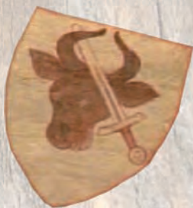
The Pomian coat of arm.

The proposed tourist route, or to be more precise its fragments, may create an interesting proposition of travel around Poland for tourists from Rhineland, reminding them of the role Cologne played in creating the cultural image of Eastern Europe and reminding about the Deutsche Kulturbesitz preserved in our country (Łąd, Kazimierz Biskupi).