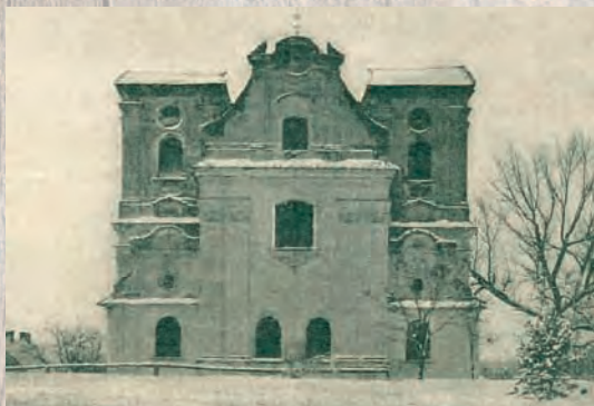
Klasztor (erem) ojców kamedułów w Bieniszewie, fundowany w 1663 r. – fotografia archiwalna.