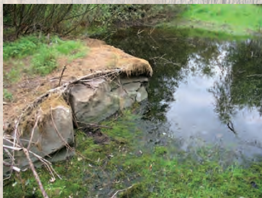
Kamieniołom w Święci.

także zawdzięczamy eksploatację źródeł solankowych (warzelnie soli) oraz kamieniołomów. Jedna z kopalni skal znajdowała się w Święci, wsi należącej do opactwa łędzkiego.