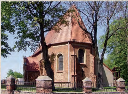
Kościół parafialny pw. św. Urszuli w Wilczynie.

K azimierz Biskupi – od połowy XIII w. centrum rozległego klucza dóbr ziemskich należących do biskupstwa lubuskiego. Prawa lokacyjne uzyskał w drugiej połowie XIII stulecia.