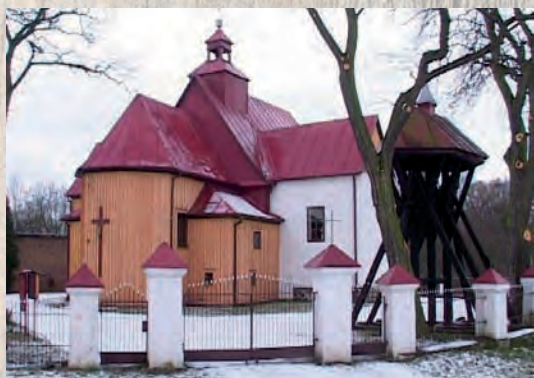
Kościół św. Jakuba Apostoła w Golinie – XVII w.

Dziedzice Goliny przez wiele lata utrzymywali bliskie kontakty z cystersami z Łądu. Świadectwem tego jest m.in. herb zachowany w kaplicy św. Jakuba w nadwarciańskim opactwie.