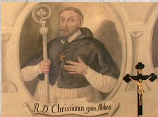
Typed image of Abbot Christianus. Abbot Room in Monastery of Łąd – 18th century.

Gosławice – a former residential noble village, currently located within the premises of Konin. In the middle of the 13th century the town was still owned by the monastery. Then it was owned by Zarembo family, and since the end of the 13th century by Godziemba family. Representatives of this family were the benefactors and customers of the abbey in Łąd for decades. Their coat of arms placed on the walls of St. Jacob the Apostle chapel in Łąd is the reflection of these connections.