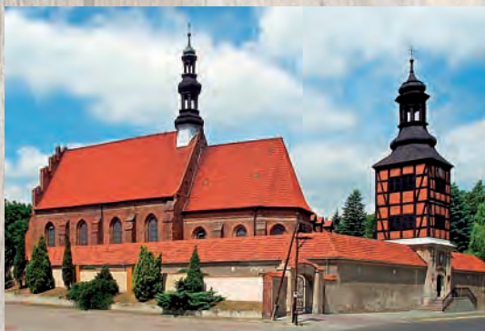
Monastery of Franciscan fathers – observants (Bernardine fathers) in Kazimierz Biskupi, erected in the second decade of the 16th century.

In the 16th century the city found itself in deposit, as owners of Kazimierz borrowed more than PLN 70 000 from the Cistercians from Łąd, which were secured on revenues from this town.