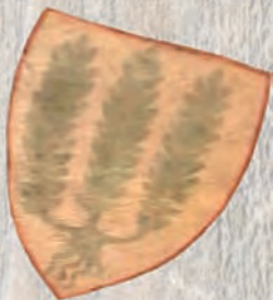
The Godziemba coat of arm.