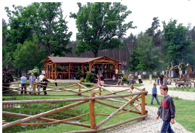
■ Ośrodek Edukacji Leśnej w Grodzku