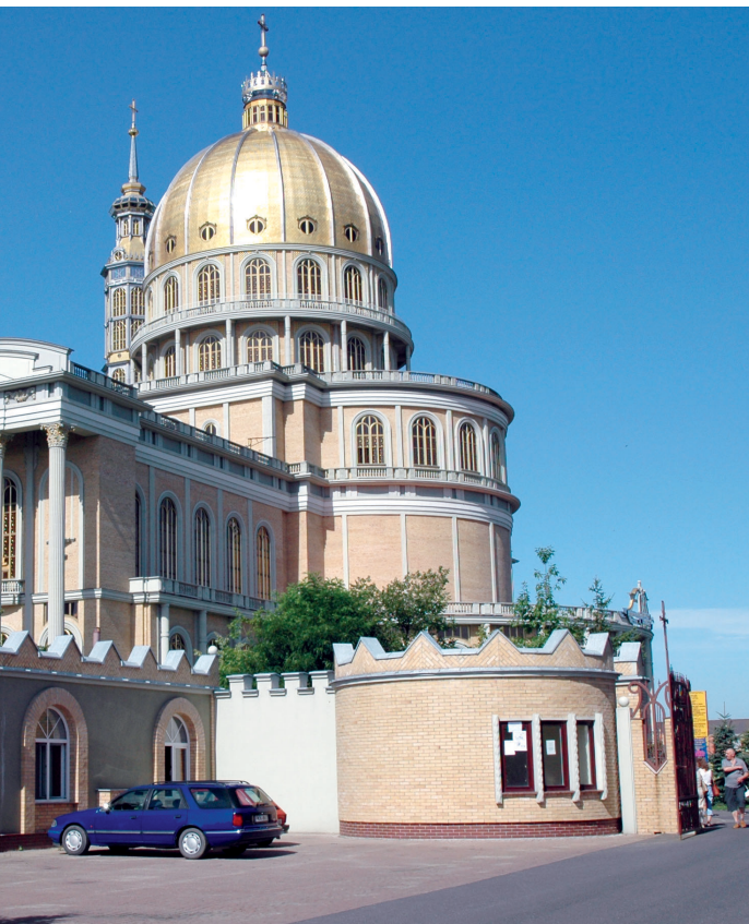
■ Bazylika w Licheniu

randze tego obszaru. Podkreśla ją romański kościół św. Marcina, jeden z trzech zbudowanych w XII w. na obszarze wschodniej Wielkopolski, oraz dwa istniejące do dziś klasztory: pobernardyński z początku XVI w. w Kazimierzu Biskupim (obecnie seminarium duchowne, posiadające w swoim muzeum misyjnym zbiory etnograficzne z Azji, Afryki i Ameryki Południowej) i XVIII-wieczny klasztor oo. Kamedułów w Bieniszewie, będący jednym z 9 funkcjonujących na świecie.