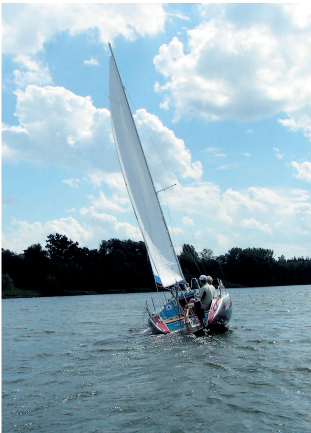
■ Kanał Warta - Gopło

Mniej znane, lecz niezwykle cenne są obiekty sakralne zlokalizowane w Kazimierzu Biskupim. Związane z tradycją kultu Pięciu Braci Męczenników, od średniowiecza zaświadcza o historycznej