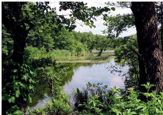
■ Rezerwat Mielno

Starostwo Powiatowe w Koninie 62-510 Konin, Al. 1 Maja 9 tel. +48 63240 32 00 fax +48 63240 32 01 www.turystyka.powiat.konin.pl