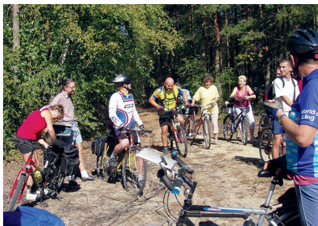
■ Szlak rowerowy