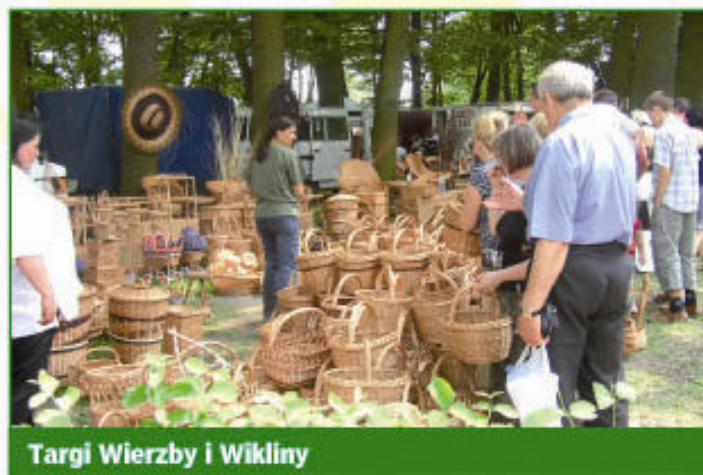
Targi Wierzby i Wikliny

Aleje 1 Maja 9, 62-510 Konin tel. +48/63 240 32 00, fax +48/63 240 32 01 www.powiat.konin.pl, e-mail: powiat@powiat.konin.pl