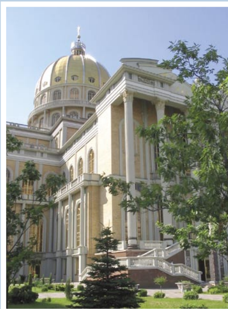
Bzylika w Licheniu Starym