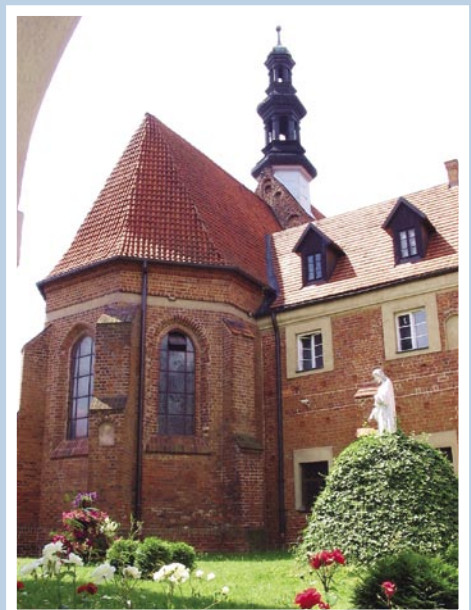
Kościół klasztorny w Kazimierzu Biskupim, fot. P. Figuski