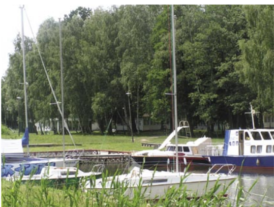
Przystań Bernardynka