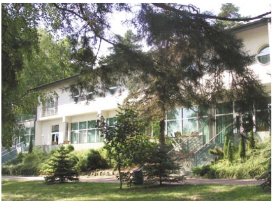
Hotel nad Jez. Mikorzyńskim

Jeśli myślisz o wspaniałym wytchnieniu i relaksie, to zaplanuj go razem z nami. Zapraszamy do malowniczego zakątka Wielkopolski, do Powiatu Konińskiego. Jego niepodważalnym atutem jest bogactwo przyrody, lasy, jeziora, rezerваты przyrody, parki krajobrazowe oraz obszary chronione. To atrakcyjne turystycznie miejsce pozostaje ciągle nieodkryte.