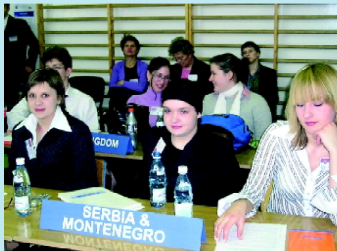
Reprezentacja szkoły podczas obrad młodzieżowego modelu ONZ

W ostatnim czasie realizowano wiele przedsięwzięć zmierzających do poprawy bazy dydaktycznej szkoły, która ma swoje budynki w