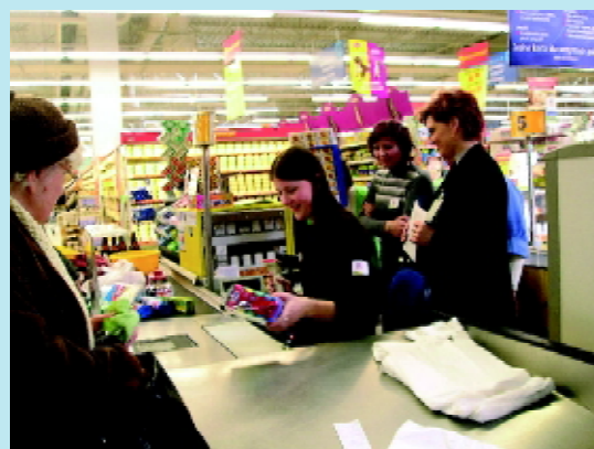
Uczennice klasy drugiej o profilu ekonomiczno-administracyjnym podczas zajęć praktycznych z przedsiębiorczości

pokolenia uczniów i rodziców sukcesy dydaktyczne i wychowawcze stanowią od lat atut szkoły, która zmienia swój wizerunek zgodnie