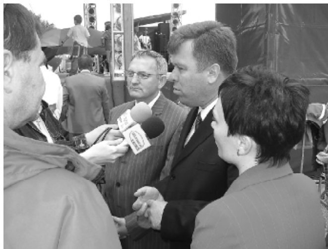
Po południu delegacja Rejonu Kozjatyńskiego przybyła do Rychwała gdzie wzięła udział w VI Wielkim Ruszeniu Gmin Powiatu Konińskiego, w trakcie którego miało miejsce podpisanie porozumienia o współpracy pomiędzy obydwoma samorządami.