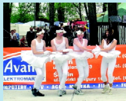
Jeziro łabędzie w wykonaniu uczniów klasy drugiej o profilu przyrodniczym

dwóch miejscowościach: Kleczewie i Wilczynie. Przeprowadzono modernizację szkoły w Wilczynie, gdzie termorenowacja budynku, wymiana okien, przebudowa wejścia frontowego oraz zainstalowanie kotłowni gazowej CO zmieniły oblicze tej placówki i stworzyły sprzyjające warunki pracy dla uczniów i nauczycieli. Natomiast przedsięwzięciem z ostatniej chwili jest gruntowna modernizacja starego budynku sali gimnastycznej w Kleczewie, dzięki czemu szkoła zyskała reprezentacyjną aulę. Bliższe już 60-lecie Liceum Ogólnokształcącego, które od 1998 roku nosi imię Adama Mickiewicza, mobilizuje do działań podkreślających ważne miejsce, jakie ta szkoła zajmuje w życiu powiatu konińskiego.