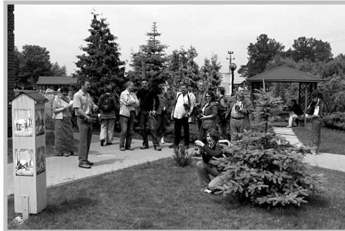
Wizyta w Ośrodku Edukacji Leśnej w Grodźcu.

Program kolejnych dni obfitował w atrakcje dla ciała (sobota) i duszy (niedziela). Dziennikarze odwiedzili konińską Starówkę, podziwiali regaty na zbiorniku retencyjnym w gm. Stare Miasto, odbyli też rejs statkiem po Jeziorze Ślesieńskim. Przyrodnicze bogactwo