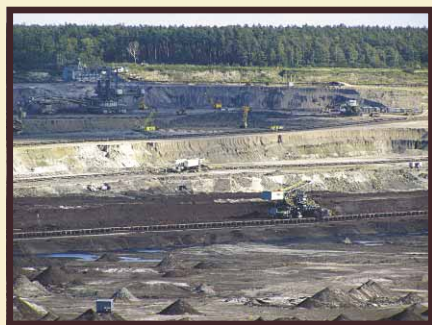
Odkrywka kopalni węgla brunatnego.

Nie bez znaczenia na ówczesny rozwój miasta miało jego położenie przy ważnych szlakach komunikacyjnych,