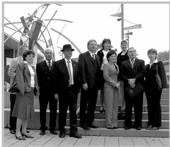
Wizyta na Uniwersytecie Technicznym w Ilmenau.