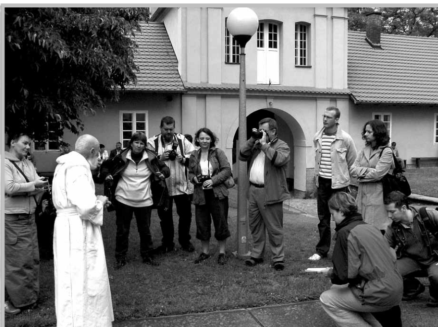
Spotkanie z gospodarzami Klasztoru w Bieniszewie.