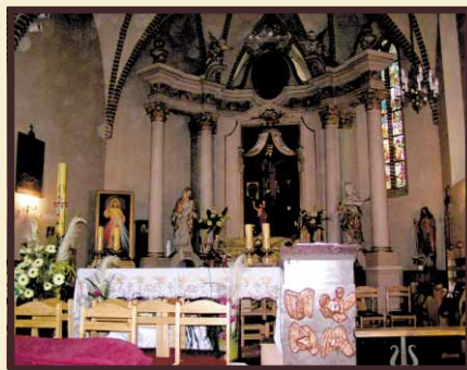
Wnętrze kościoła parafialnego p.w. św. Andrzeja Apostoła w Kleczewie.

W 1793 r., w wyniku II rozbioru Polski miasto przeszło pod panowanie pruskie. W latach 1807-1815 znalazło się w granicach Księstwa Warszawskiego, a od Kongresu Wiedeńskiego – w granicach Królestwa Polskiego. Do dnia dzisiejszego, w miejscowości Anastazewo, możemy podziwiać kompleks budynków dawnego przejścia granicznego pomiędzy Prusami a Rosją.