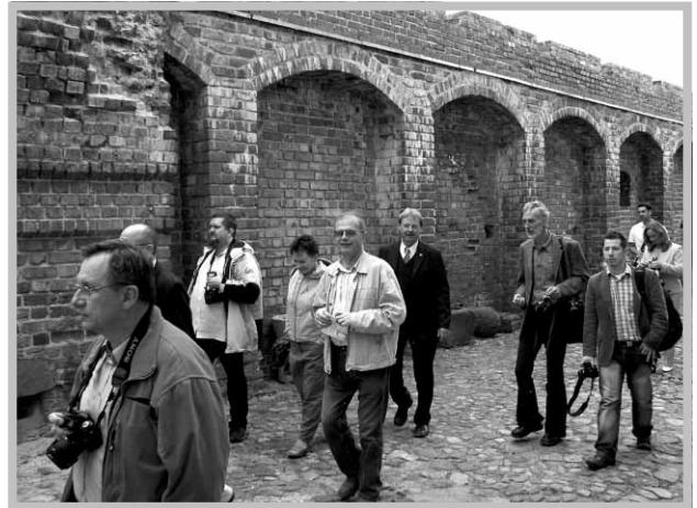
W Muzeum Okręgowym w Koninie.

Była to świetna okazja by w dość nietypowy sposób podziwiać zbiory zgromadzone w Muzeum Okręgowym w Koninie, jak również poznać lokalne przysmaki podczas kolacji z konińskimi włodzarami.