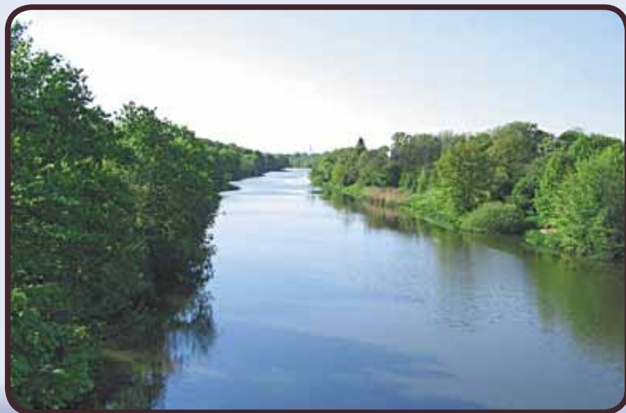
Dolina rzeki Warty

Krzysztof Piechocki