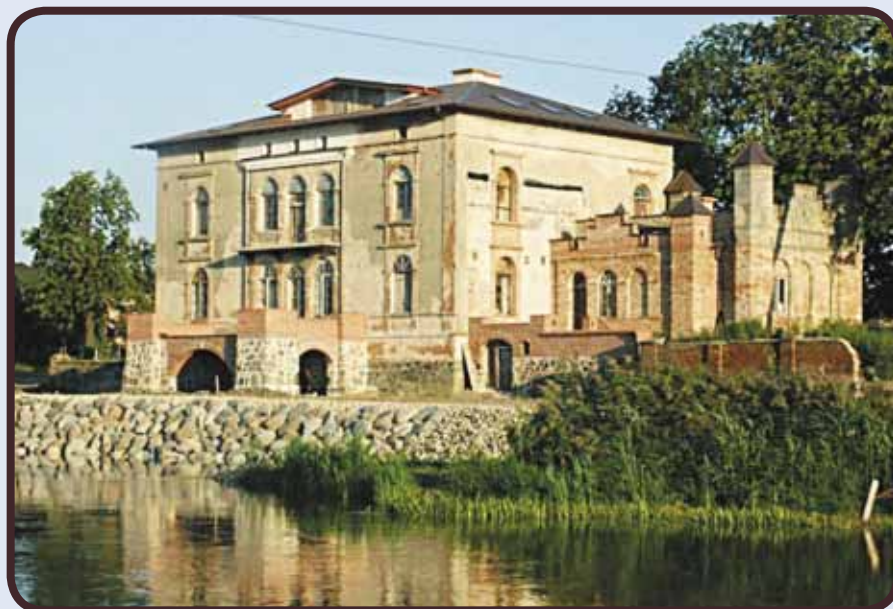
Pałac w Sławsku

Park ten został utworzony w 1995 r. w celu ochrony środowiska przyrodniczego, swoistych cech krajobrazu, zachowania ze względów przyrodniczych, naukowych i dydaktycznych miejsc lęgowych ptactwa wodnego i błotnego oraz ochrony ptaków przelotnych, a także zabezpieczenia wartości historycznych tego regionu. Atrakcją parku są ciekawe okazy flory i fauny. Doliczono się tutaj ponad 1.000 gatunków roślin, w tym 57 gatunków