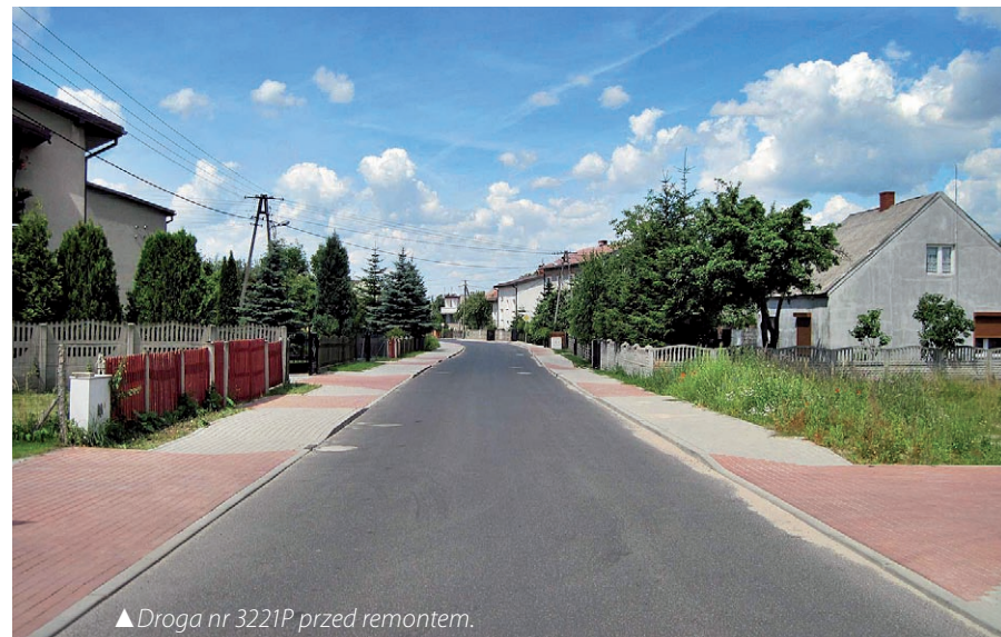
▲ Droga nr 3221P przed remontem.

Warto dodać, że w latach 2010 – 2014, samorząd powiatu konińskiego przeznaczył na realizację projektów inwestycyjnych w drogownictwie 58,5 mln zł, w tym budowa i remonty dróg pochłonęły prawie 48 mln zł. W efekcie intensywnych prac modernizacyjnych oddano do użytku 71 km nowej nawierzchni dróg oraz 18,4 km.